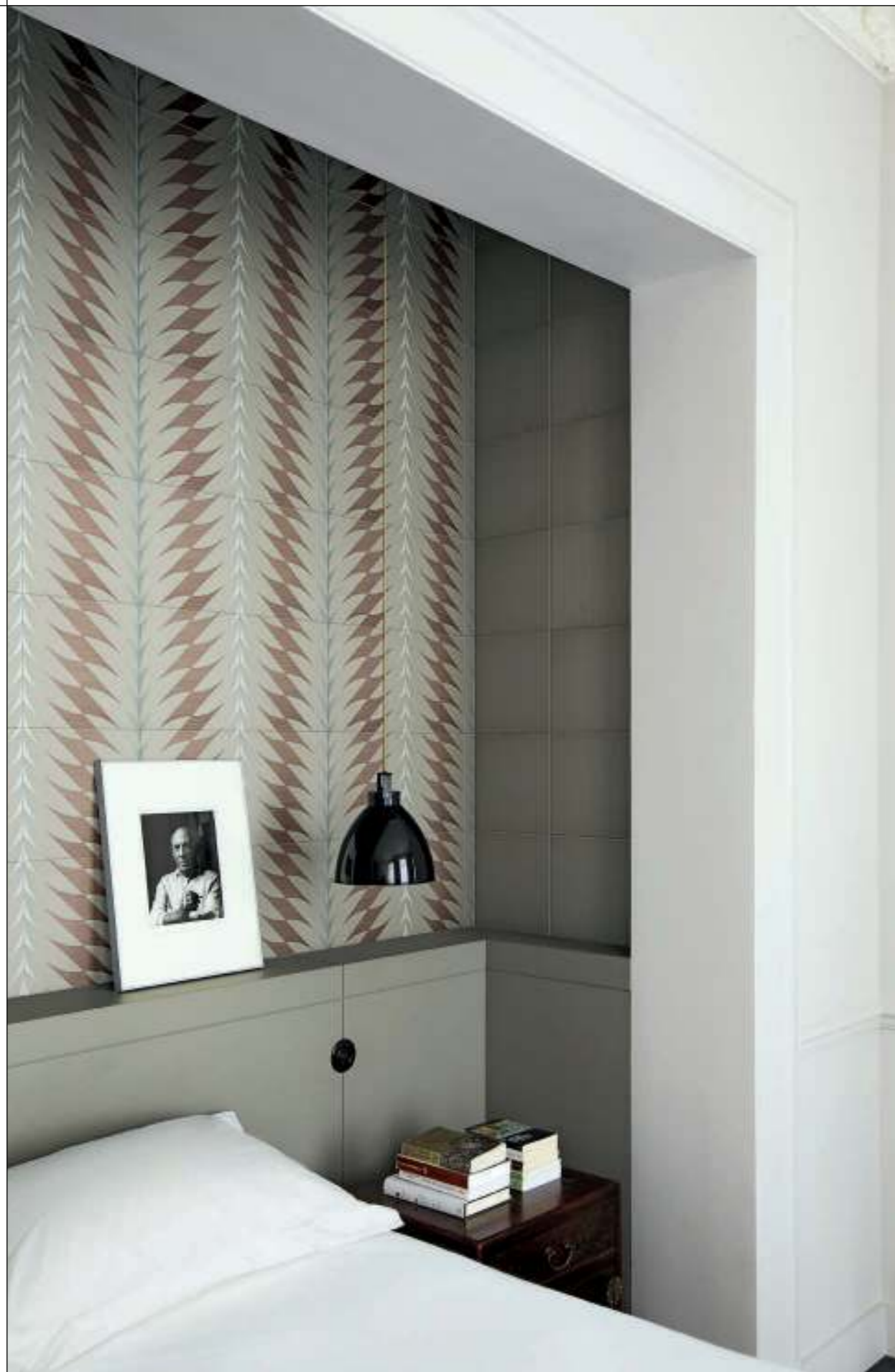
CONTRACT, FLEURS 2A-2B-2F Rivestimento posa a campo pieno / Covering, all over layout