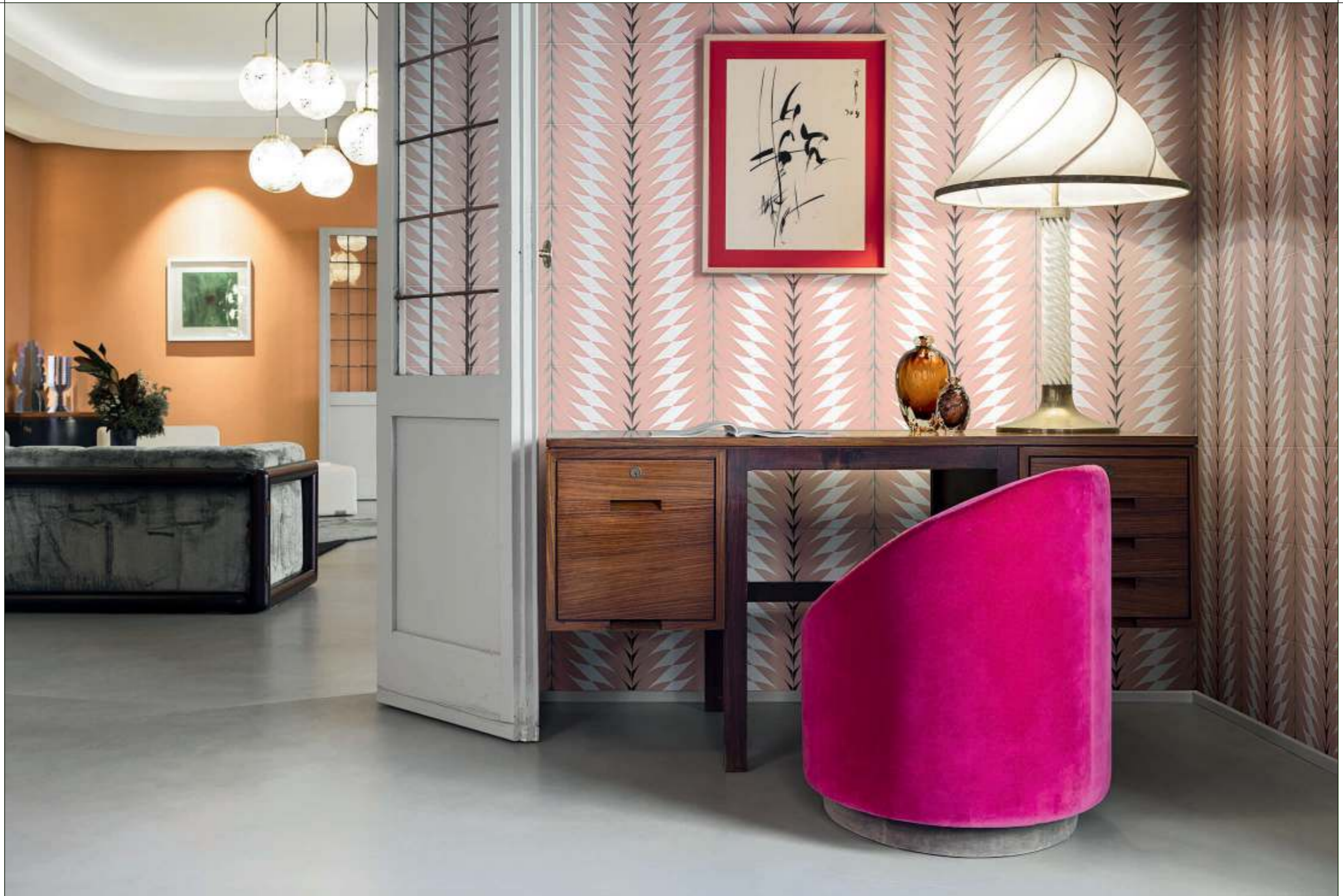
LIVING, FLEURS 3A-3B Rivestimento posa a campo pieno / Covering, all over layout