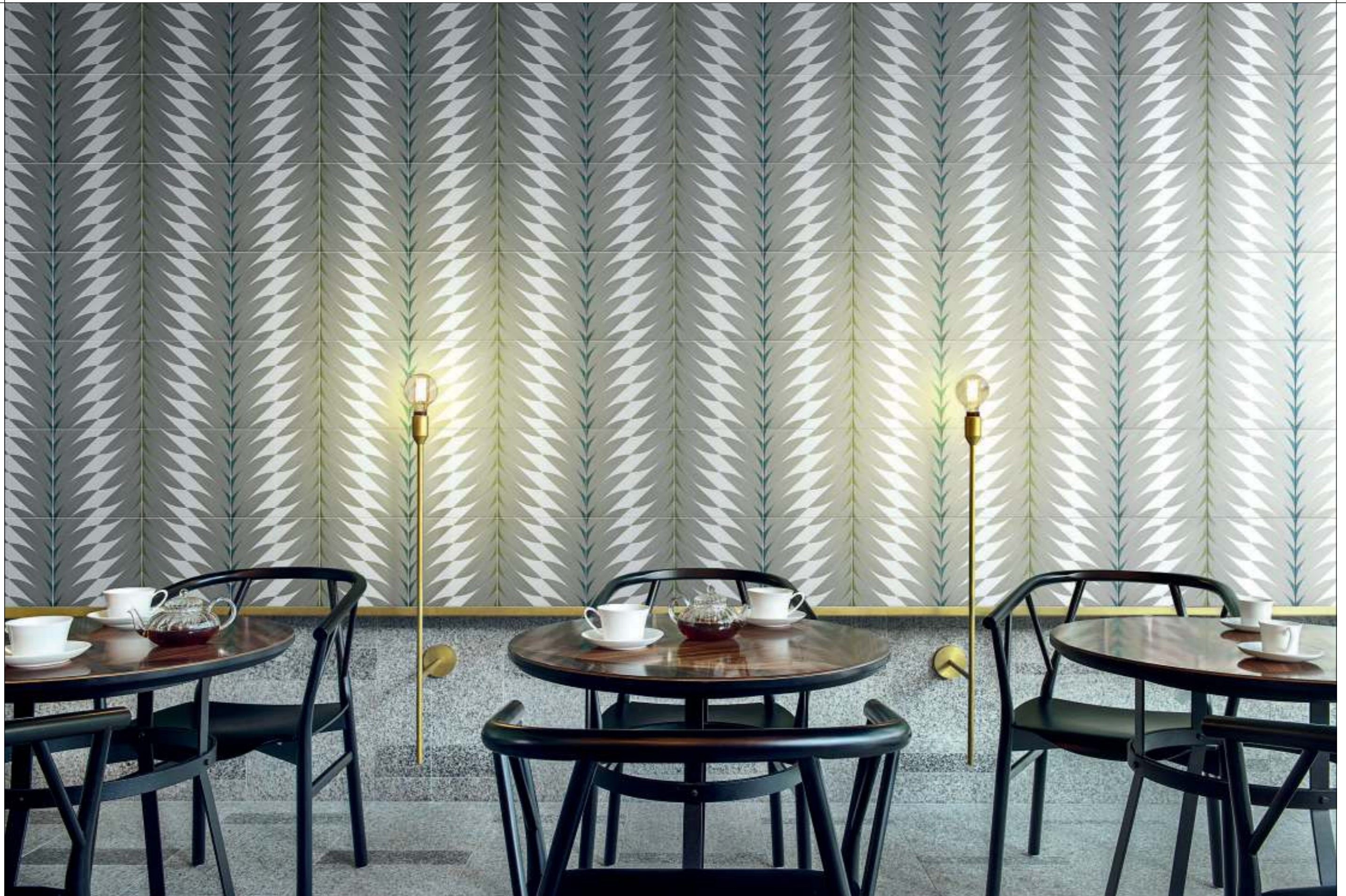
CONTRACT, FLEURS 4A-4B Rivestimento posa a campo pieno / Covering, all over layout