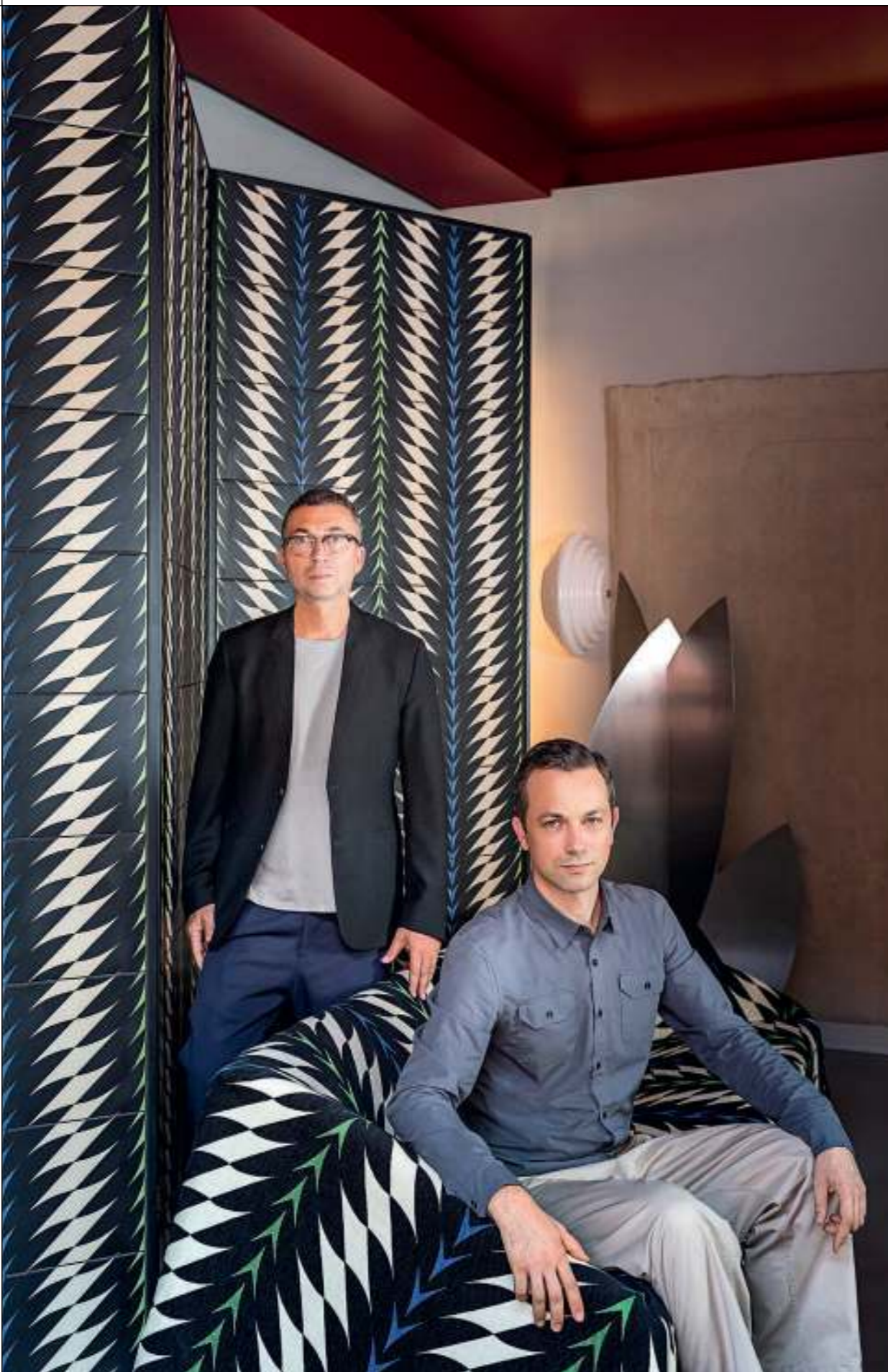
Gherardo Tonelli / Pierre Gonalons, portrait

Abstract gardens, neat textures of lines and bright colors, turned into sparkling corollas and explosive foliage. A magical flora, absolutely invented and very original, transformed into ceramic decoration by Ceramica Bardelli in collaboration with Paradisoterrestre. Fleurs, the author's new ceramic tiles inspired by Giacomo Balla's Futuristic Flowers, are made of glazed stoneware, size 26x26cm. The collection is characterized by 4 basic colors - black, gray, light pink and mastic - and 4 different decorated versions, inspired by the shades of the original decorations. An anthropic and futuristic reconstruction of nature that, appealing to the laws of geometry, transforms the walls into imaginary gardens. A unique visual impact, a coating embellishing walls by creating small grafts or extended backgrounds, depending on use. Ceramica Bardelli decorates every tile in the collection by hand, giving humanity and softness to the original geometric design. This stroke, combined with the smooth glazing of the tile, make Fleurs a small jewel for the residential wall covering. Thanks to this collaboration with Paradisoterrestre, Ceramica Bardelli confirms once again its sensitivity towards the enhancement of made in Italy design and tightens its ties even more with the world of art, and the avant-gardes.