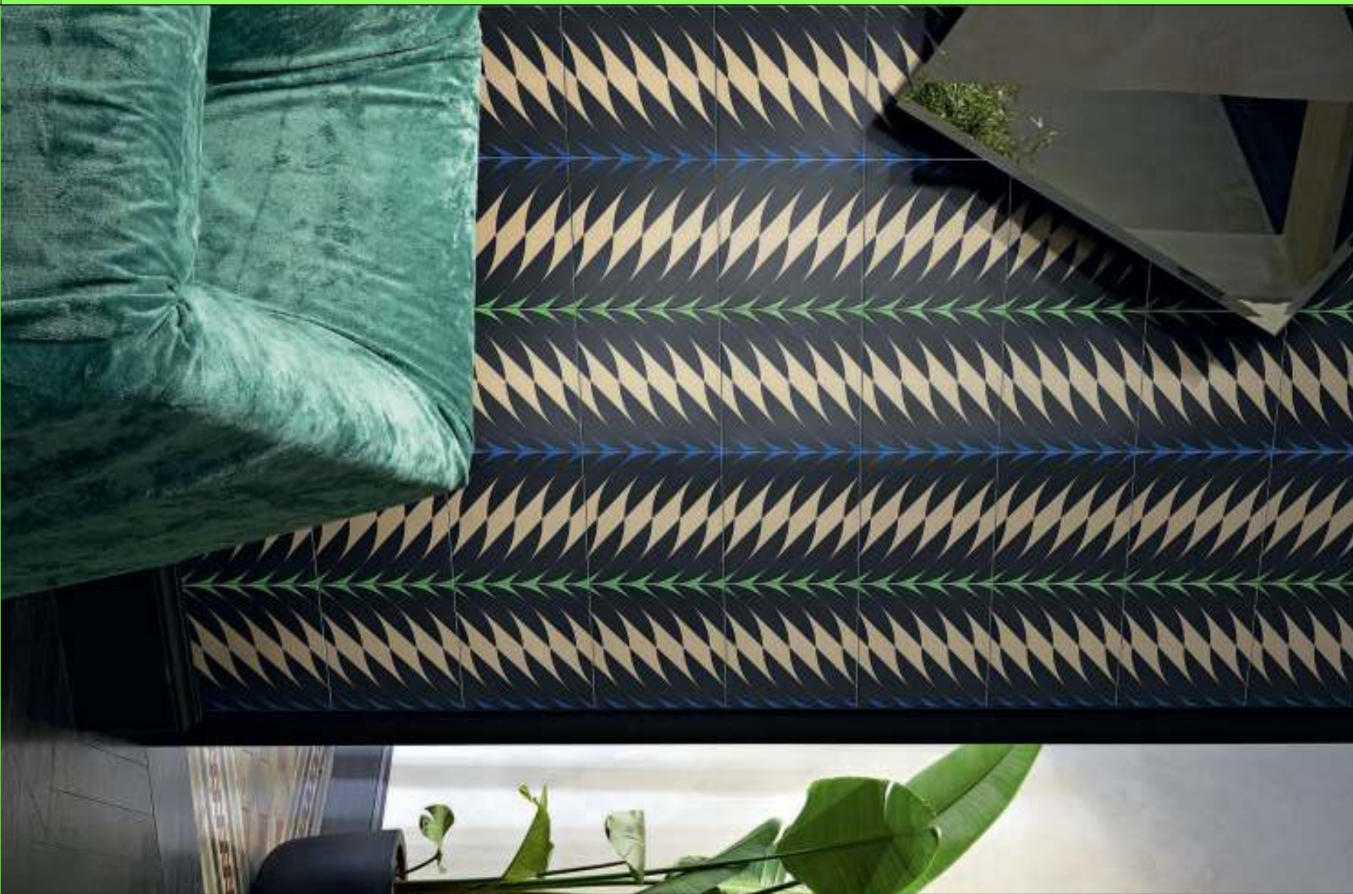
FLEURS design Paradisoterrestre