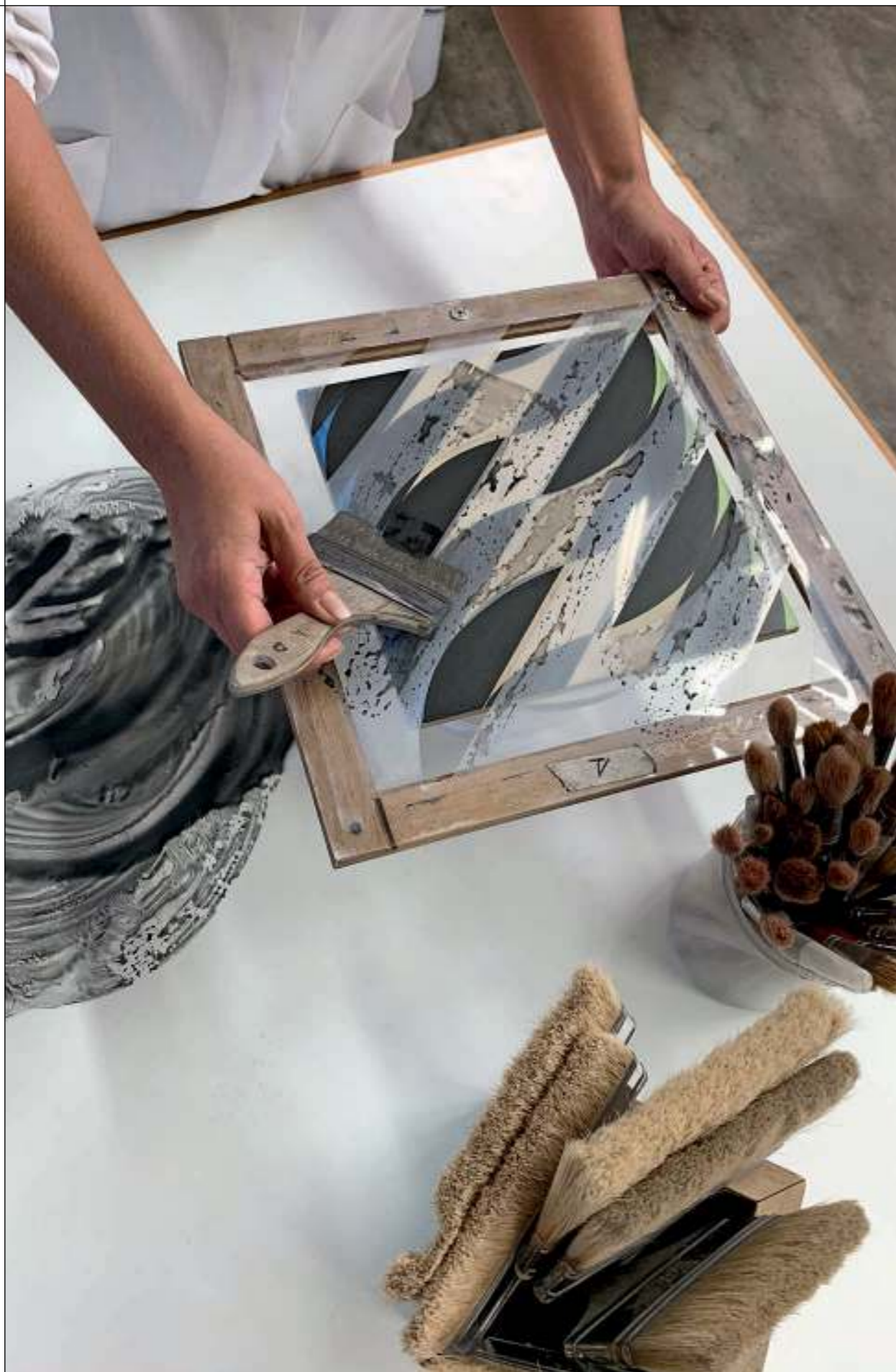
PENNELATO A MANO / HAND PAINTED

Collezione di piastrelle da pavimento e rivestimento d'interni, in grès smaltato finitura opaca; composta da due decori specchiati tra loro e affiancati, interamente pennellati a mano. Il design, ispirato ai Fiori Futuristi di Giacomo Balla, mescola il dinamismo futurista e l'arte cinetica. La collezione è disponibile in quattro varianti cromatiche e una gamma di quattro tinte unite pennellate a mano, perfettamente coordinate ai decori. Formato 26x26 cm, spessore 10 mm.