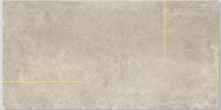
★ LINES2B - PEI IV / R10 / DCOF - (con listello ottone o acciaio - with brass or steel strip)