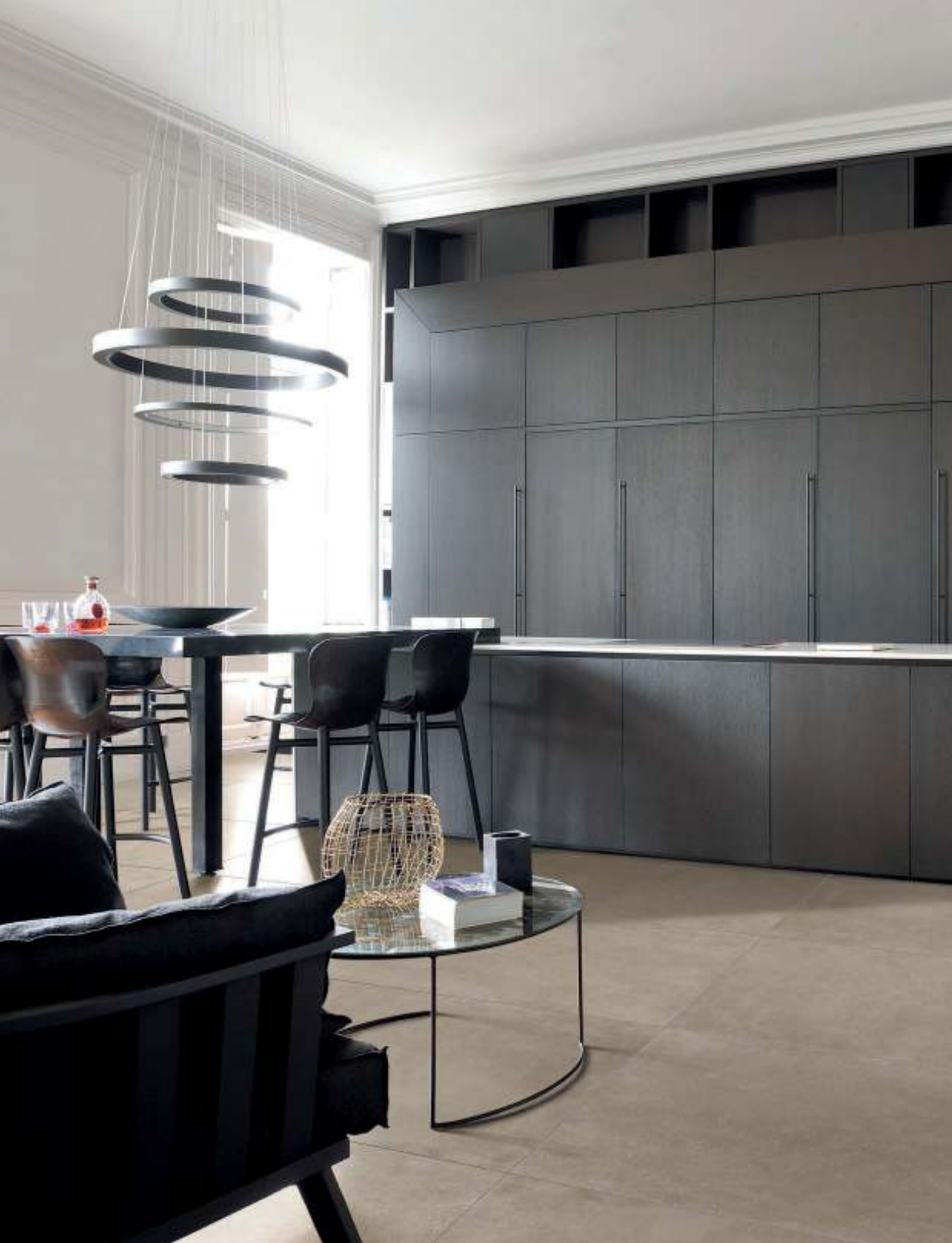
CUCINA/KITCHEN, pavimento / flooring LINES 2A-3A (cm. 60x120 - 24"x48")