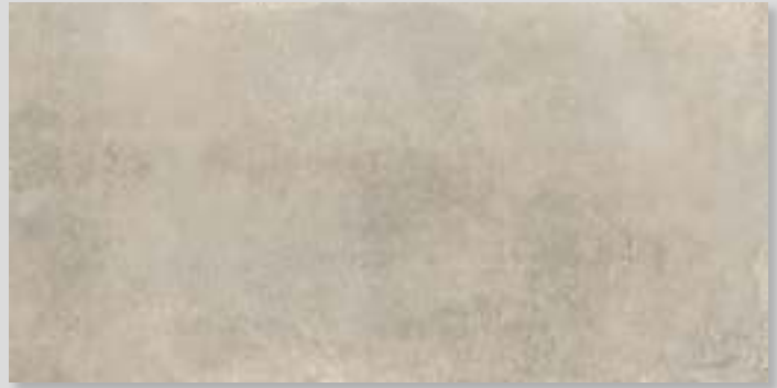
LINES2A - PEI IV / R10 / DCOF