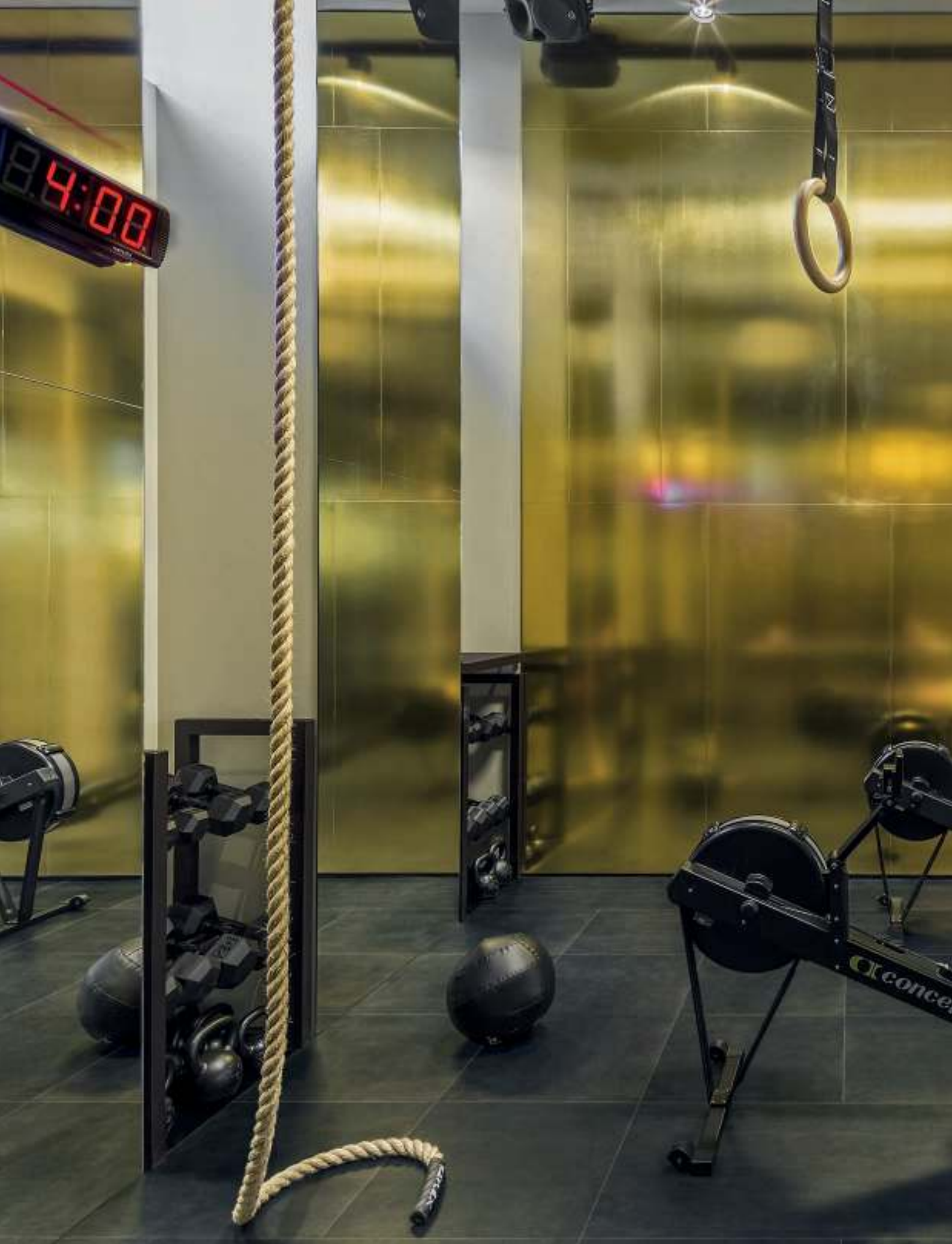
CONTRACT pavimento / flooring LINES 3A (cm. 60x60 - 24"x24" / cm. 60x120 - 24"x48")