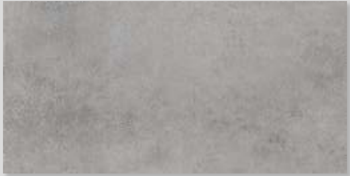
LINES 1A - PEI IV / R10 / DCOF