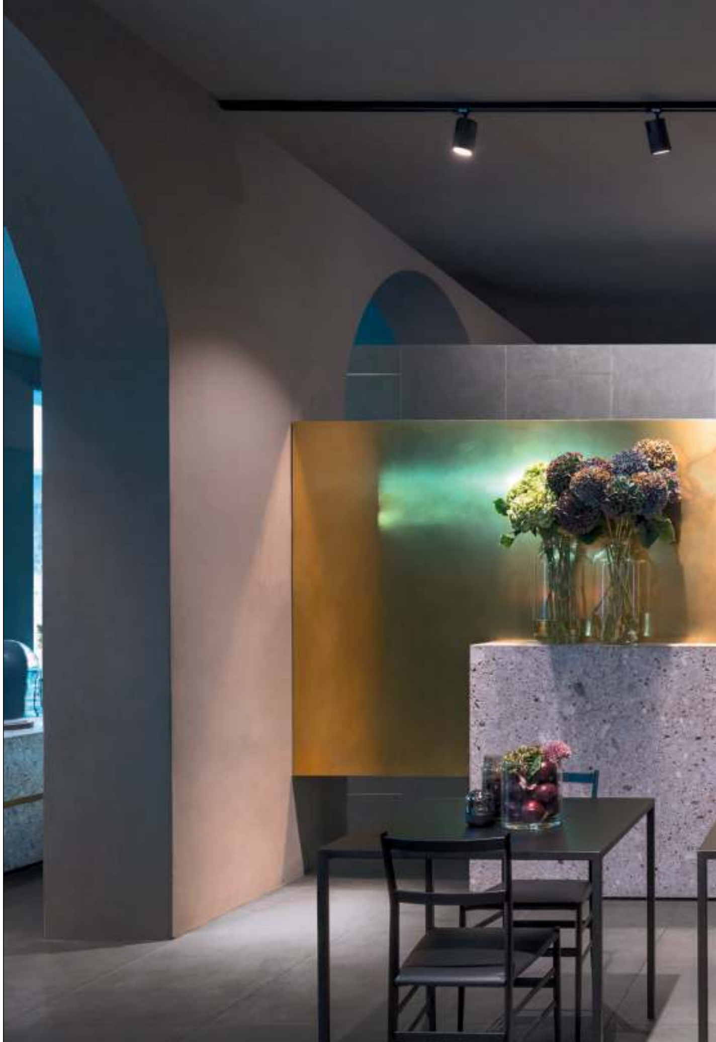
LIVING , pavimento / flooring LINES 1A (cm. 60x120 - 24"x48"), Rivestimento / covering LINES 1B (cm. 60x60 - 24"x24")