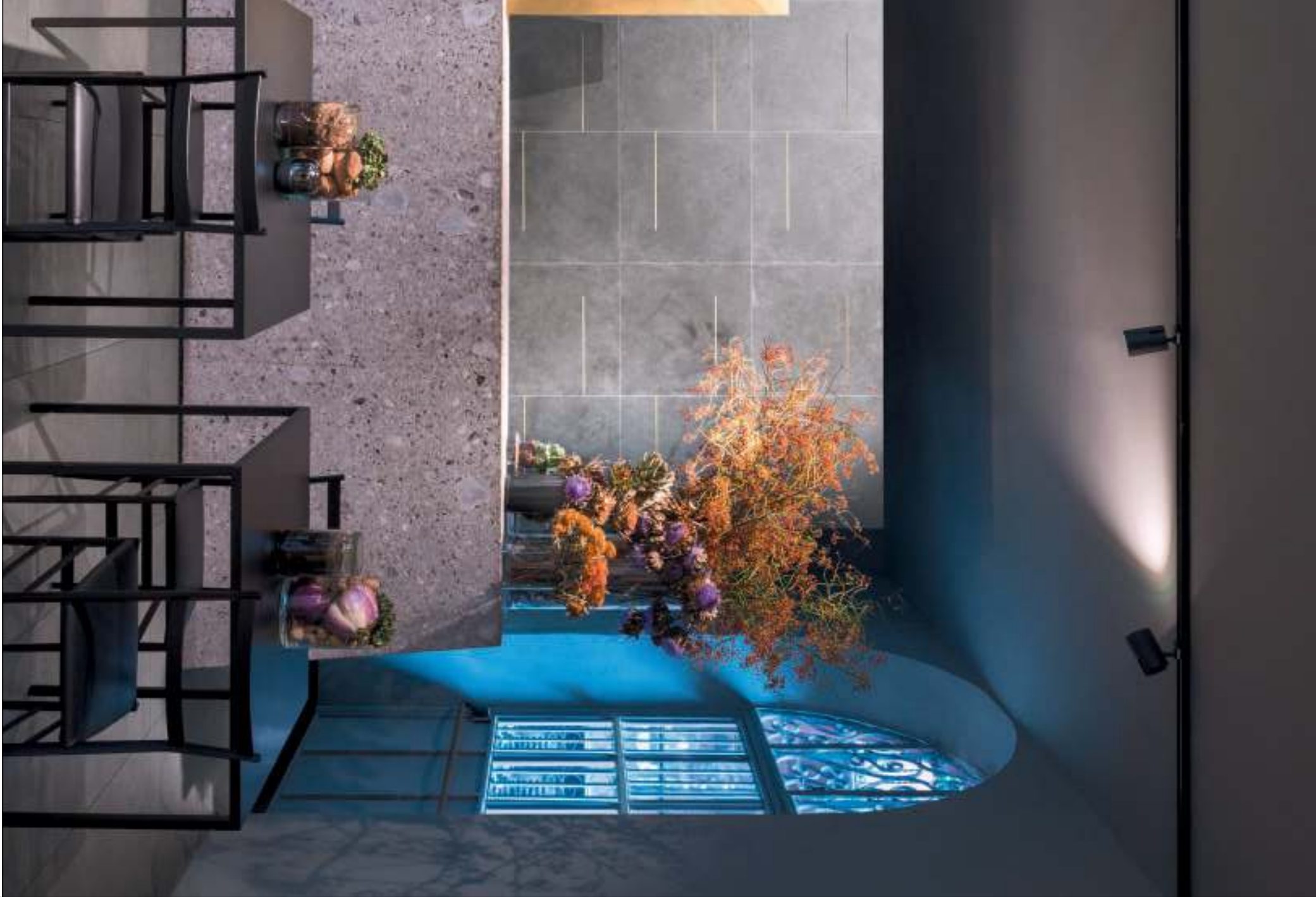
Potafiori - Project by Storamilano - © Paola Pansini