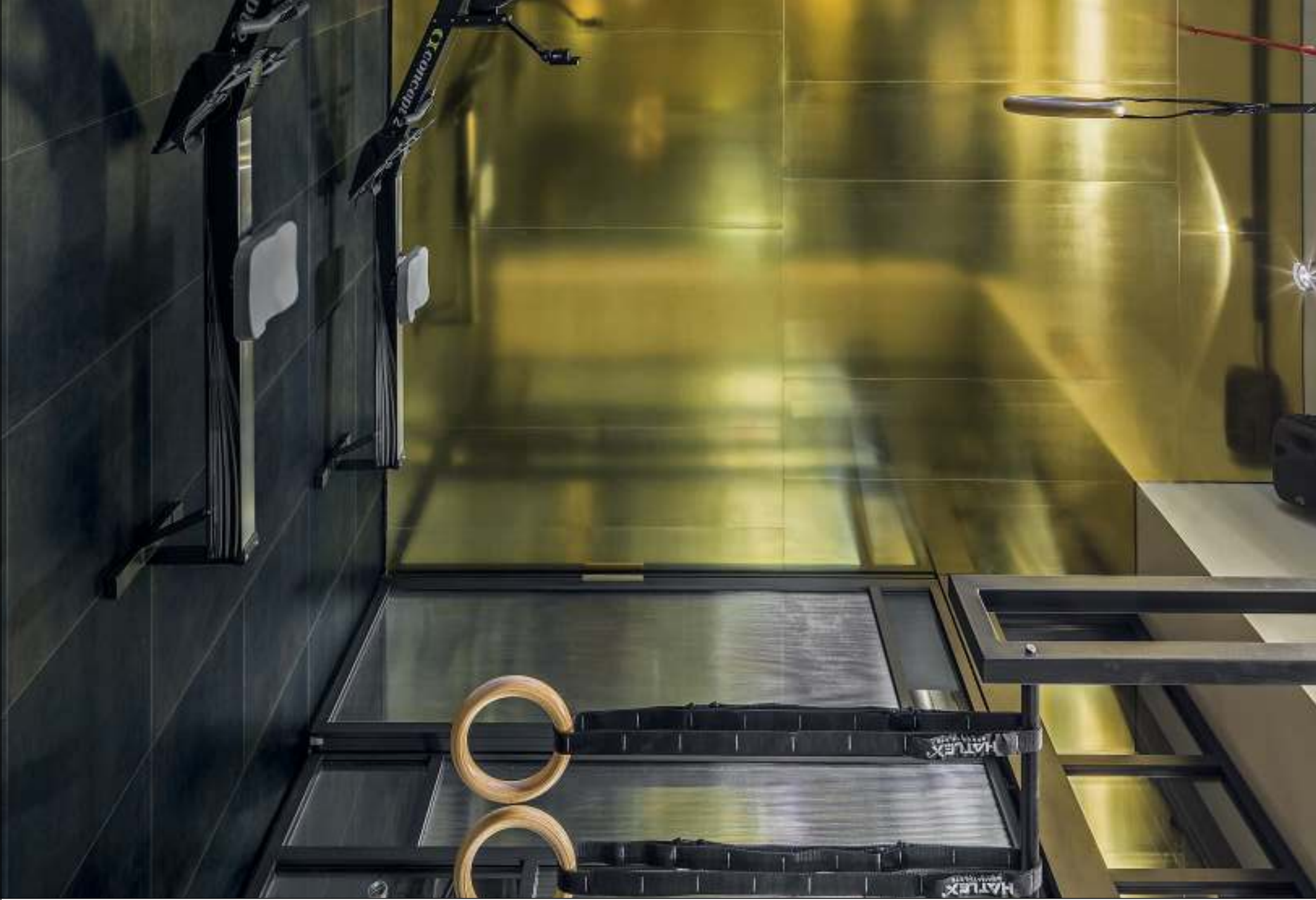
Disquared - project Stagemilano