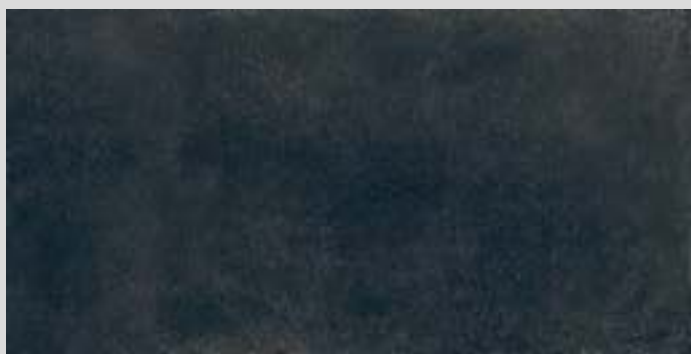
LINES 3A - PEI III / R10 / DCOF