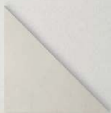
cm 25 x 25 x 35 (10"x10"x14")