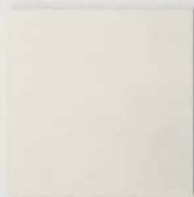
cm 25 x 25 (10"x10")

A collection of indoor floor and wall tiles made of rectified glazed stoneware, including fourteen matt colours in three categories - neutral, background and accent colours - and available in three different sizes. The choice of a solid matt colour giving the collection a silky consistency is enriched with a material texture recalling the weave of printed canvas stamped into the tile: subtle, almost imperceptible variations encouraging the onlooker to approach the tile and discover all its unique details. All Pittorica shapes and sizes, square 25x25 cm - rectangular 6x25 cm and triangular 25x25x35 cm, with a thickness of 10 mm - can be mixed and matched to permit complex, creative decorative schemes. The decorative properties of Pittorica are enhanced by the new rectified formats, which guarantee laying solutions with minimal joints for both floors and walls, bringing out the full, modern spirit of colour expressiveness.